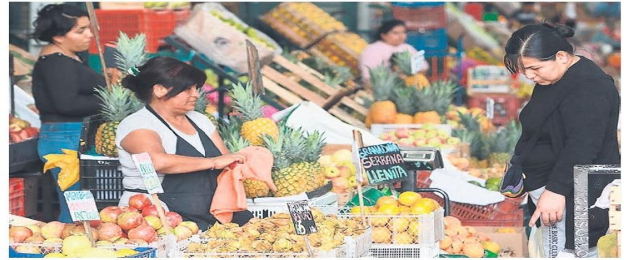
CIFRAS. Según INEI, 323 productos de la canasta familiar subieron ligeramente de precio.

7,2% en los últimos 12 meses y 5,2 puntos porcentuales por encima de la inflación. ♦